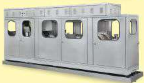
电补涂机 Electrocoater 用于易拉盖补涂。 For Lacquer Post-Repairing of Easy Open Ends.