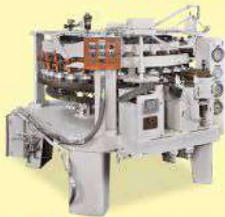
易拉盖检测机 Easy Open End Tester