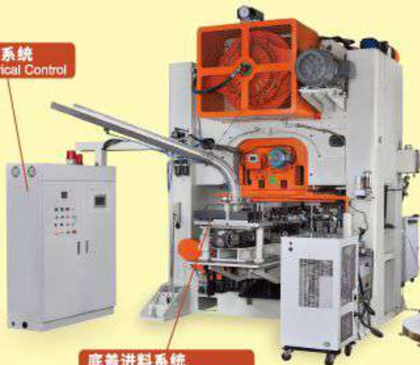
电控系统 Electrical Control